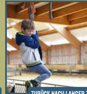
ZURÜCK NACH LANGER ZEIT: AXTSTIELHÄNGEN. COOL!