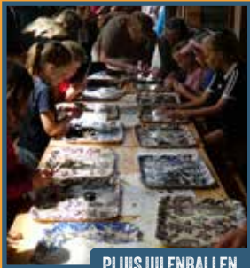
PLUIS UILENBALLEN... SPANNEND!

Stichting Het Drentse Veenland, Natuurpark Moor-Veenland, Staatsbosbeheer, Veenloopcentrum, Smalpoormuseum, Fun & Feestverhuur Assen (schminken), Supporter van Schoon (Gem. Emmen) en vele anderen nodigen alle gezinnen uit voor een speciale familiedag in het Bargerveen. Natuurlijk zijn opa's en oma's ook van harte welkom.