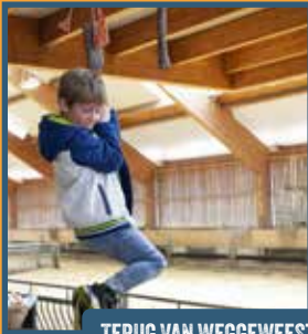
TERUG VAN WEGGEWEEST: BIJLSTEELEN. STOE!