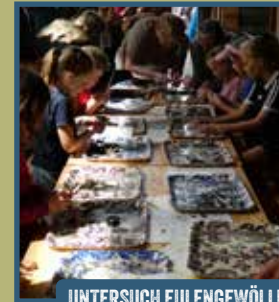
UNTERSUCH EULENGEWÖLLE... SPANNEND!

Stichting Het Drentse Veenland, Natuurpark Moor-Veenland, Staatsbosbeheer, Veenloopcentrum, Smalpoormuseum, Fun & Feestverhuur Assen (schminken), Supporter van Schoon (Gem. Emmen) und viele andere laden alle Familien ganz herzlich zum Familientag im Bargerveen ein. Selbstverständlich sind auch Oma und Opa herzlich eingeladen!