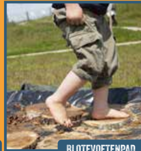
BLOTEVOETENPAD... LEKKER GLIBBERIG!