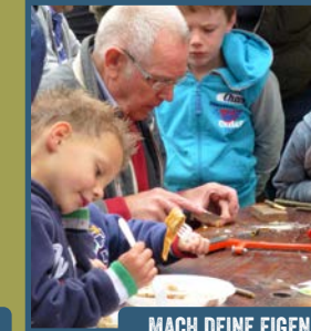
MACH DEINE EIGENE PFEIFE AUS EBERESCHE