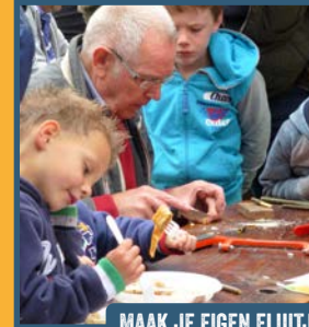
MAAK JE EIGEN FLUITJE VAN LIJSTERBES