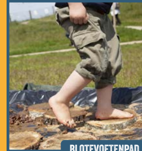
BLOTEVOETENPAD... LEKKER GLIBBERIG!