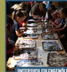
UNTERSUCH EULENGEWÖLLE... SPANNEND!

Stichting Het Drentse Veenland, Natuurpark Moor-Veenland, Staatsbosbeheer, Veenloopcentrum, Smalpoormuseum, Fun & Feestverhuur Assen (schminken), Supporter van Schoon (Gem. Emmen) und viele andere laden alle Familien ganz herzlich zum Familientag im Bargerveen ein. Selbstverständlich sind auch Oma und Opa herzlich eingeladen!