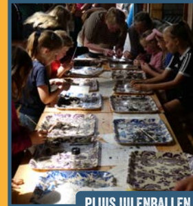
PLUIS UILENBALLEN... SPANNEND!

Stichting Het Drentse Veenland, Natuurpark Moor-Veenland, Staatsbosbeheer, Veenloopcentrum, Smalpoormuseum, Fun & Feestverhuur Assen (schminken), Supporter van Schoon (Gem. Emmen) en vele anderen nodigen alle gezinnen uit voor een speciale familiedag in het Bargerveen. Natuurlijk zijn opa's en oma's ook van harte welkom.