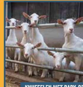
KNUFFELEN MET BABY-GEITJES