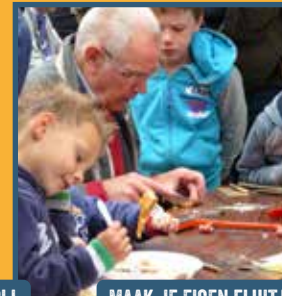
MAAK JE EIGEN FLUITJE VAN LIJSTERBES