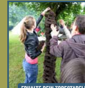
ERHALTE DEIN TURFSTAPELDIPLOM BEIM VEREIN 'T AOLE COMPAS

Stichting Het Drentse Veenland, Natuurpark Moor-Veenland, Staatsbosbeheer, Veenloopcentrum, Aspergeboerderij Sandur, Smalspoomuseum, Bienenzentrum Haren und viele andere laden alle Familien ganz herzlich zum Familientag im Bargerveen ein. Selbstverständlich sind auch Oma und Opa herzlich eingeladen!