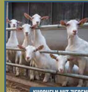
KUSCHELEN MIT ZIEGENBABYS