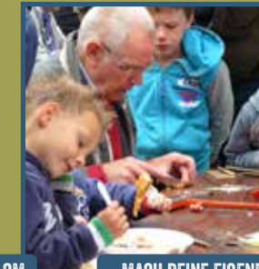
MACH DEINE EIGENE PFEIFE AUS EBERESCHE