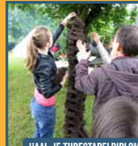
HAAL JE TURFSTAPELDIPLOMA BIJ VERENIGING 'T AOLE COMPAS

Stichting Het Drentse Veenland, Natuurpark Moor-Veenland, Staatsbosbeheer, Veenloopcentrum, Aspergeboerderij Sandur, Smalspoomuseum, Bienenzentrum Haren en vele anderen nodigen alle gezinnen uit voor een speciale familiedag in het Bargerveen. Natuurlijk zijn opa's en oma's ook van harte welkom.